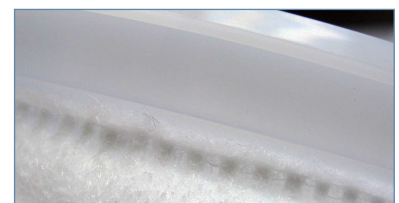
Verschweißung Formteil/ Filtermaterial

Technische Änderungen vorbehalten. AL1007-04