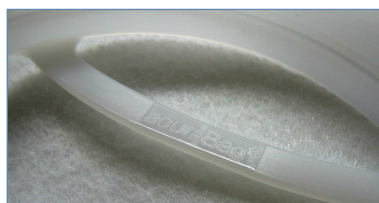
Formteil mit Handgriff